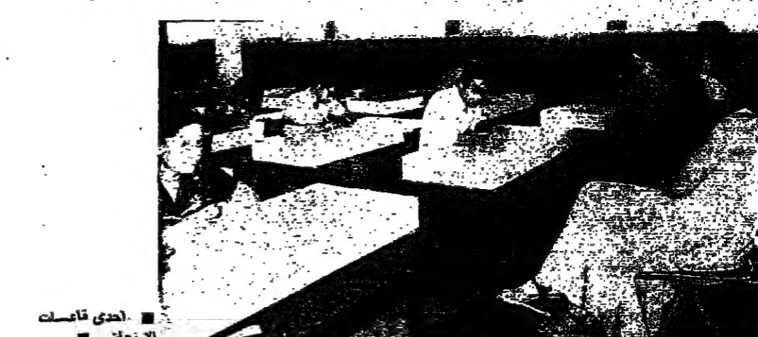
احدى قاعات الامتحان

جديدا في بعض التمديلات الحديثة وبعض المذاقة في شطب كلمة في سطر وايات في سطر اخر ، مع التفتت باحكام اريد « باسم الهبة » منها تسييس الجامعة عن طريق افعال المشهور بهم والشهيد لهم واصحاب التعاقبات التي تبرز وتضيق الحدة . واذا مع ان هذا التصرف هو نهائي فلا بد من بعض ملاحظات : اولا : في الرسوم ١٨ يوما ، قامت دنيا التعليم وتعدت بمسدهه ويهي مجهول القايمة . اذا سئل مسؤول عن نضه ولو في سبيل المفاضة فكان يلا بالصمت والتكتم وكنته من الرثيق لا يمكن التمسك به . وثانيا : ولو وجدنا جدلا شيئا من العذر في ان نرى بعض الاحكام كما وردت في التص الاول وسببه عادل السيرة فلا يمكن - اذا صح التص الجديد - ان يبقى هذا العذر تقيا بعد ان سلطت الاثارة على الخطله .